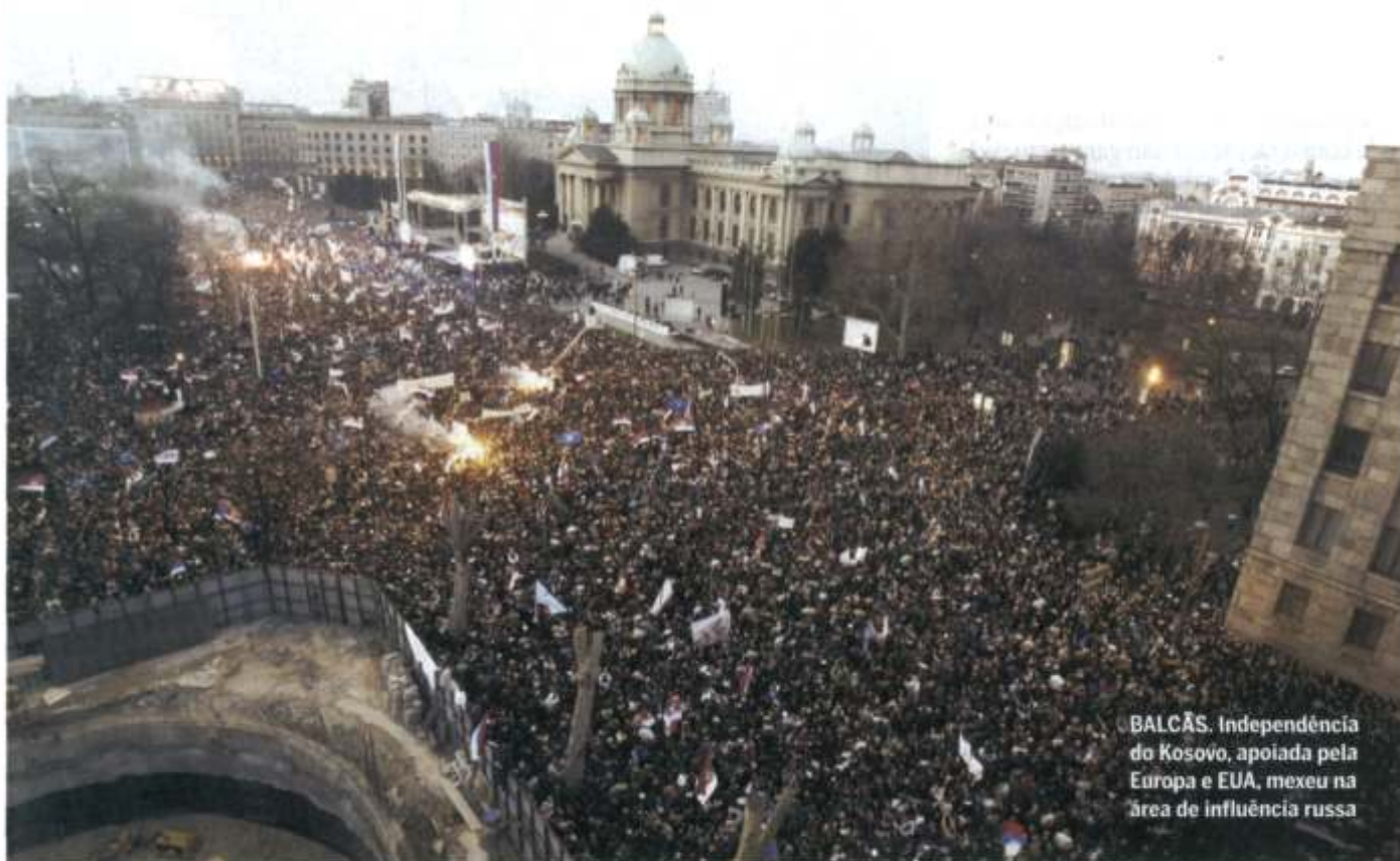
BALCÃS. Independência do Kosovo, apoiada pela Europa e EUA, mexeu na área de influência russa