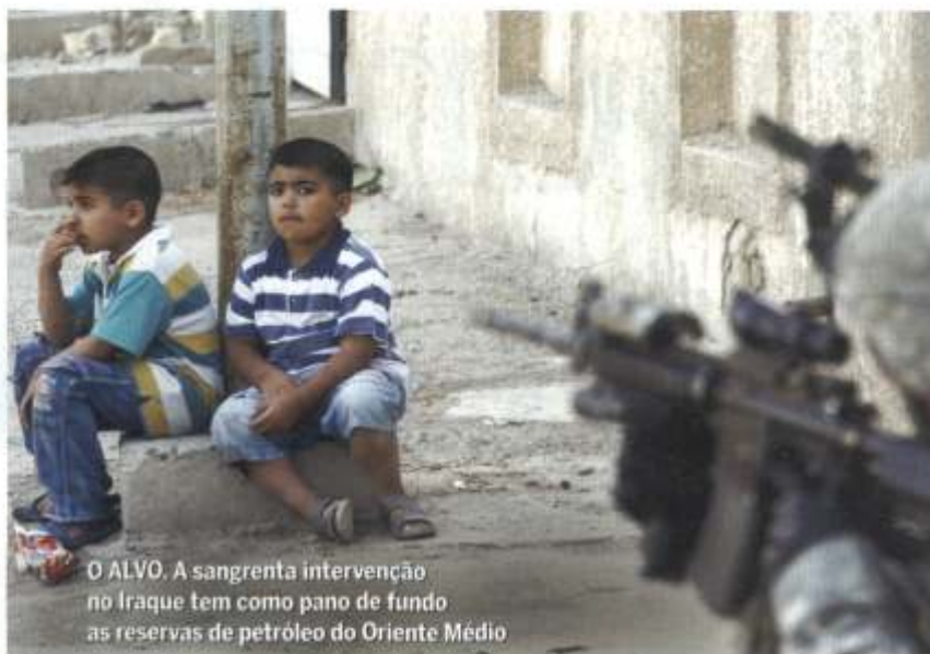
O ALVO. A sangrenta intervenção no Iraque tem como pano de fundo as reservas de petróleo do Oriente Médio

Nessa guerra dos dutos, a Rússia amargou séria derrota em 2005: a inauguração do oleoduto Baku-Ceyhan, grande duto regional que contorna o território russo, ligando o Vale do